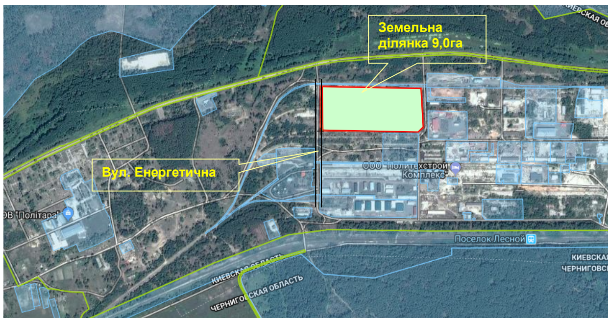
Схема розміщення земельної ділянки для будівництва електростанцій з використанням енергії сонця по вул. Енергетична (Будбаза) орієнтовною площею 9,00 га